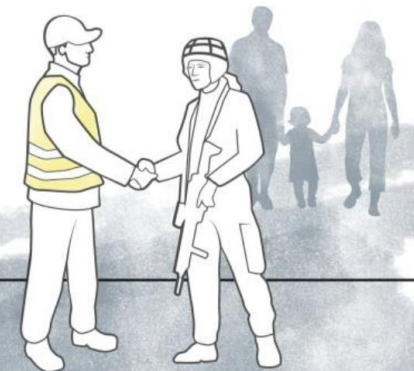
Illustration 1 - Det övergripande målet för totalförsvaret, målet för det militära respektive civila försvaret